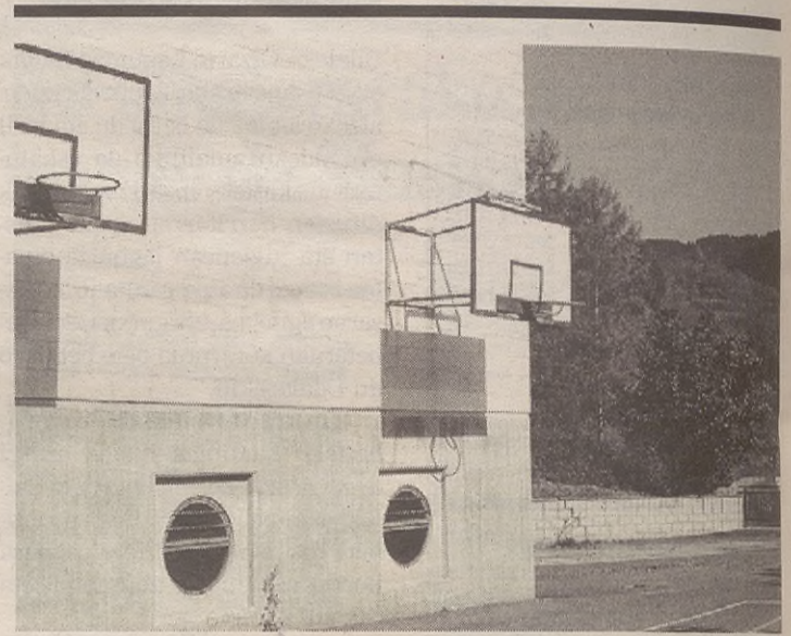
Eskolaren ondoan dagoen espazio horretan egingo dute eraikin berria.

Kontuan hartzeko gaixotasuna da su-gorrina, batez ere Aramaion dauden sagarrondo piloa ikusita. Frantziatik sartu da Gipuzkoara eta handik etorri da gureganaino, mintegien bitartez.