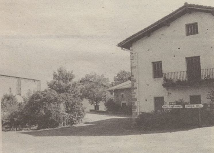
Azkoagatik kilometro batera dauden zuhaitz eta landareak zaindu beharko dituzte.

Lehen esandako moduan, asmoa da eskolak Haurreskola zerbitzua eskaintzea eraikin berri horretan. Hau da, laster, 0 eta 2 urteko umetxoak ere hartu ahal izango dituzte San Martin Eskolan.