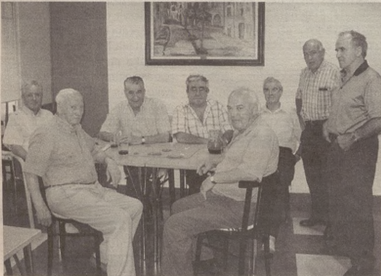
Argazkian, Alaiak elkarteko zenbait kide, erretiratuen egoitzan.

Horrez guztiaz gainera, irailaren 23rako Iruñara txangoa antolatu dutela ere jakinarazi digu erretiratu eta pentsiodunen elkarteak. Besteak beste, Oteiza museo ikustera joango dira. Horrez gainera, txikiteoa eta bazkaria ere izango dituzte. Txangora joan nahi duenak irailaren 16a baino lehen 25 euro sartu beharko ditu Euskadiko Kutxan.