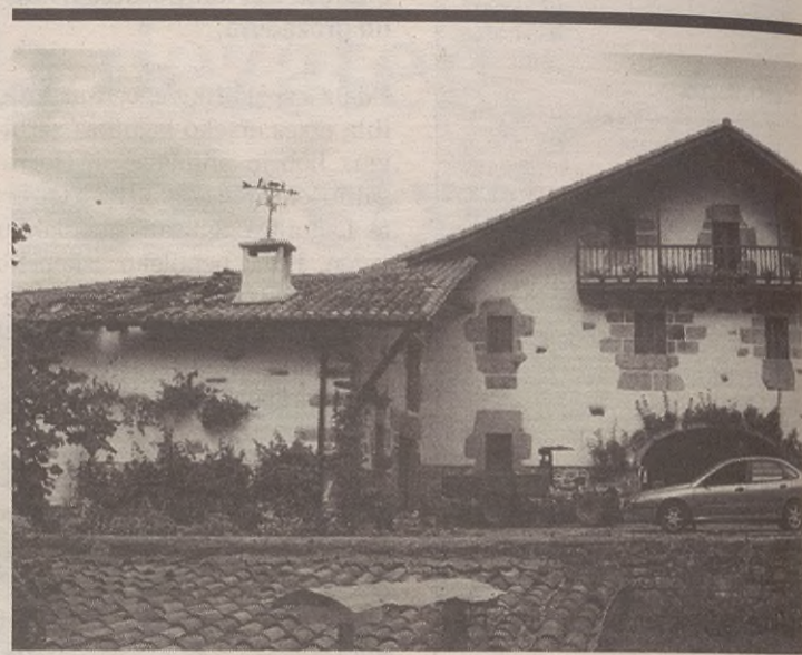
Biltegiak ez ditu kalte handiegirik erakusten; baina sortu zen arriskua handia izan zen.

Informazio gehiagorako: 945 18 16 02 telefonora deitu edo librosdetexto@alava.net -en begiratu.