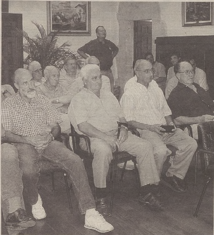
Azkoagatik kilometro batera dauden auzotarrak, asteleheneko batzarrean.

Diputazioko ordezkariak jakinarazi zuten hilabete honetan ingurua ikuskatzen hasiko direla eta ikusten badute zuhaitzen batek itxura eskasa duela analisiak egingo diotela; eta egoera oso eskasa bada, zuhaitz hori errotik atera eta erre egin beharko dutela. Trukean, zuhaitz