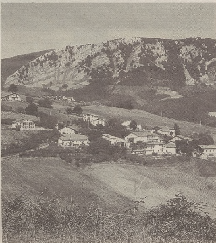
87.000 euro inbertituko dute Zabola eta Untzillaren arteko bidea konpontzen.

Horrez gainera, bestelakoen artean, ekonomia kontuekin ere aztertu zituzten zinegotziek. Hain justu ere, araudi berri bat onartu dute, behin betirako. Plusbalioarekin edo gainbalioarekin lotutako araudia da, norberaren jabetzari ezartzen zaion plusbalioaren