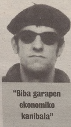
"Biba garapen ekonomiko kanibala"

Zein irizpide erabiltzen duzun da kontua. Oso ondo: potentzia ekonomiko bat gara. Autopista polit bat egin behar digute, jende pila bat etorriko da gu ikustera, dirua utziko dute gure taberna