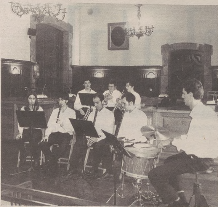
Arrasate Musikaleko zazpi txistularik egingo dute kontzertua Gantzagan.

Interesa duenak esandako orduetan KZgunera joatea besterik ez du. Informazio gehiago behar izanez gero: 943 79 99 44.