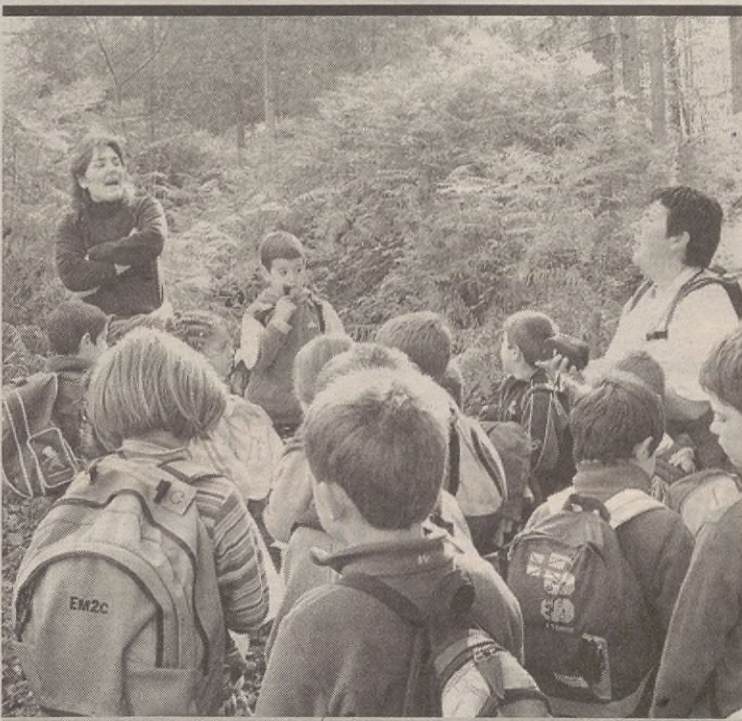
Iaz ikasle dezentek parte hartu zuen Trikitixa Egunean; argazkian, kalejira egiten.