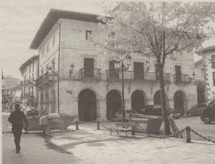
Orain arte beste hiru bider ipini diote errekurtsioa Udalari; argazkian, udaletxea.

Demanda arrazoitzeko, bi argudio ematen ditu Estatuko abokatuak: batetik, dirulaguntza hori ematea ez dela Aramaio Udalaren eskumena; eta bestetik, dio dirulaguntza horrekin