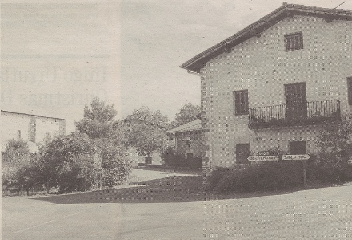
Azkoaga auzotik kilometro bateko bueltan dauden fruta-arbola guzti-guztiak aztertu dituzte Diputazioko teknikariak.

Horrez gainera, infekzio-fokua aurkitu zuten lekutik kilometro batera zeuden baserri guztietako fruta-arbolaren laginak hartu eta aztertu zituzten Diputaziokoek.