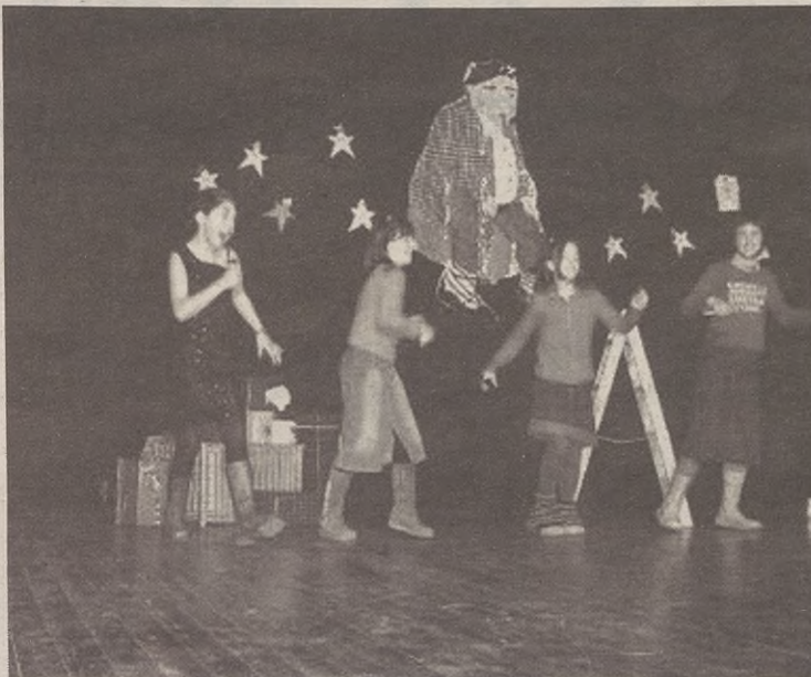
SAN MARTIN ESKOLA

Edozelan ere, egun horretako ekintzarik bereziena arratsaldean izango da. Gabonetako jaialdia izango dugu eta guztiok parte hartuko dugu; besteak beste, abestiak, antzerkiak eta dantzak egingo ditugu. Gainera, aur-