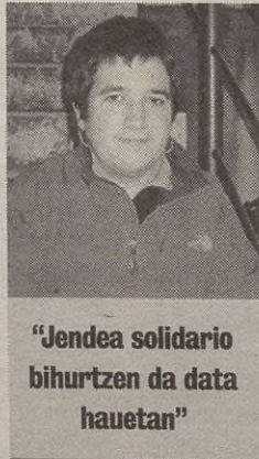
"Jendea solidario bihurtzen da data hauetan"

Txikitzen gogoratzen naiz, Gabonak zoragarriak zirela, elurra egiten zuen, Olentzero etor-