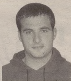
"Eiñ deigun beti euskeraz lelengo berbak"

Hau Bitorixan pasau jaten baño, zoritarrez, Euskal Herriko beste edozein herri be izen leiken. Egoerie be (euskeraz ez jakitte hori) normala eitten jaku, asumirute moduen daukegu leku danetan euskeraz eziñ eiñ hori. Bañe honek emuten dau zer pentsau. Bat: geure herriren, Euskal Herriren, bertako hizkuntzie dan euskerie eziñ geinke leku danetan ebali, beraz, euskaldunok eziñ geinke euskeraz, normalidade danaz, bizi Euskal Herriren. Bi