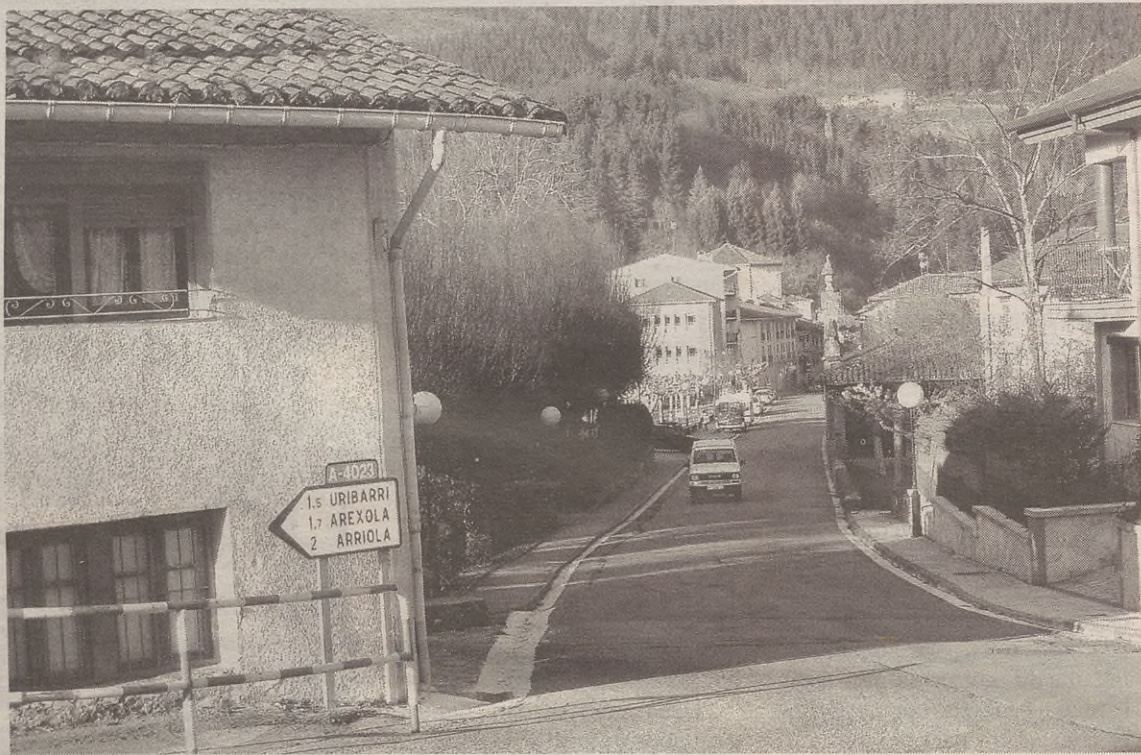
Auzoak indartzeko ahaleginean, besteak beste, Arriola, Errotabarri eta Salgo berritu nahi ditu Udalak, eta herriko bideak konpondu.

Hain zuzen ere, honako inbertsio hauek nabarmendu dizkigu