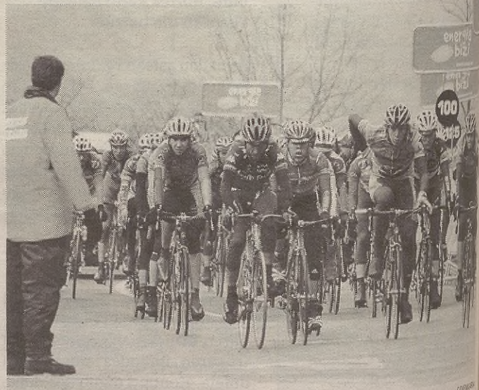
Oñatin izan berri ditugu txirrindulari profesionalak; laster etorriko dira Gatzagara

Euskal Bizikleta herrira ekartzeko asmoa joan den urtekoa da. Dorletako Amaren urterena zela aprobetxatuz, herriko ziklismo zaleak horretan ahal leindu ziren. Orduan lortu ez zutena orain lortu dute. Hala, amateur mailan Leintz Gatzagara egiten den lasterketak izena badauka ere, laster profesionalak ikusiko ditugu herrian”.