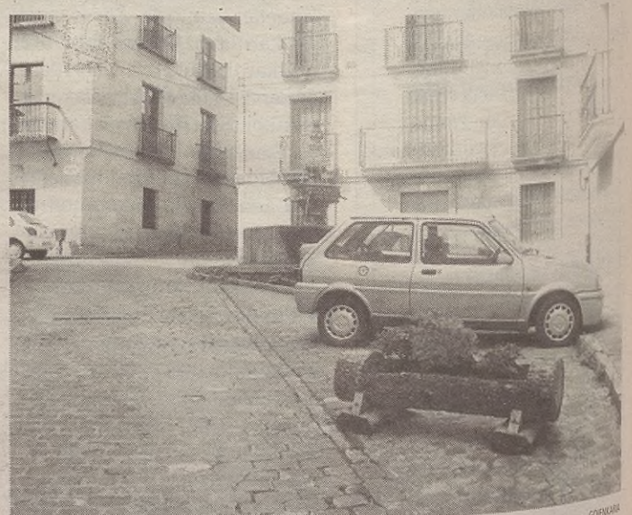
Lurzorua jasoko dutenez, Gatzagako hainbat kale hankaz gora egongo dira.

hodiak sartzeari izango da lan horien helburu nagusia, baina ura eramaten duten hodi zaharrak aldatzea ere. Horrekin batera, ur-hargune gehiago ere jarriko dituzte. Joan den urtean suhiltzaileak izan ziren herrian, eta Gatzagan hiru ur-hargune badaude ere, ura botatzeko mahukek ondo ibiltzeko behar duten gutxieneko presioa ez zen nahikoa. Eta hori behar den moduan jartzeko ere egingo dituzte lanok.