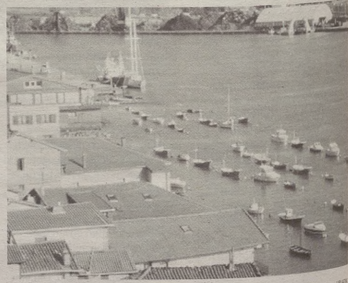
Pasaiako portuaren sarreran dauden etxeak.

Horiek guztiak aste barruan egingo dituzte, baina asteburutan ere ez dira aspertuko. Uztailaren 23an afaria egingo dute Bengoerrekan, eta Dorletan igaroko dute gaua.