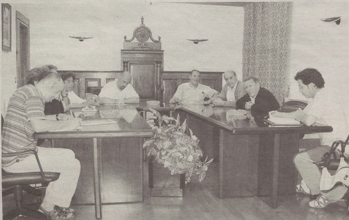
Eguaztenean batzarrean zehaztu zuten Udalak egingo dituela aldarrikapenak, baina talde guztien babesarekin.

Esan gabe doa Gatzagak duen gabezia handiena garraio bide publikorik eza dela. Eta, hori da Gatzagako bizilagunek egingo duten lehenengo aldarrikapena: “Salatzekoa da Diputazioak Debagoieneko garraio bide arazoak aztertzen dituen txosten askotan Leintz Gatzaga alde batera utzi duela. Kontuan ere ez gaituzte hartzen, eta ez Diputazioak bakarrik, Mankomunitateak ere sekulako erraztasuna dauka Gatzaga alde batera uzteko”.