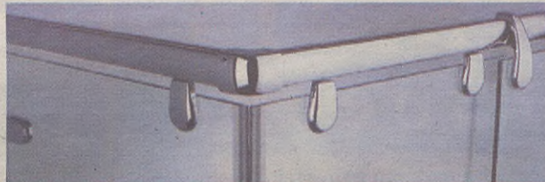
Beira eta altzairu herdoilgaitzezko manpara dotoreak