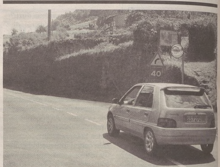
Argazkian dagoen eskuinaldeko horma botako dute errepidea zabaltzeko.

Akaso, talde gehiago egin beharko genituzke, adina kontuan hartuta. Kontua da orain guztiak ibiltzen direla batera, haurrak eta gaztetxoak. Eta aproposagoa izango litzateke banaketa egin, eta talde bakoitzean adinaren araberrako ekintzak egitea. Hori izan daiteke hobetze aldera egin daitekeen zerbait, baina taldeak txikiagoak izango lirateke; hori ere kontuan hartu behar.