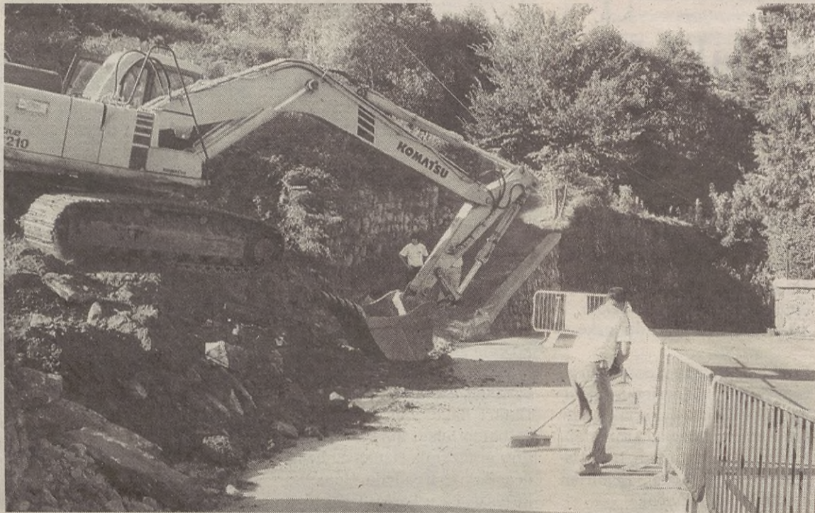
Kamioia lurra deskargatzera joanda, hondeatzeko makina kamioia datorrenerako prestatzen.

Eguraldiak okerrera egin ez badu, langileek astebururako gura zuten goiko sarrerako lana amaitzea: “Lurra kentzearena bai, behintzat. 400-500 metro kubiko lur aterako dugula aurreikusten dugu. Errepidea bost metro zabal-