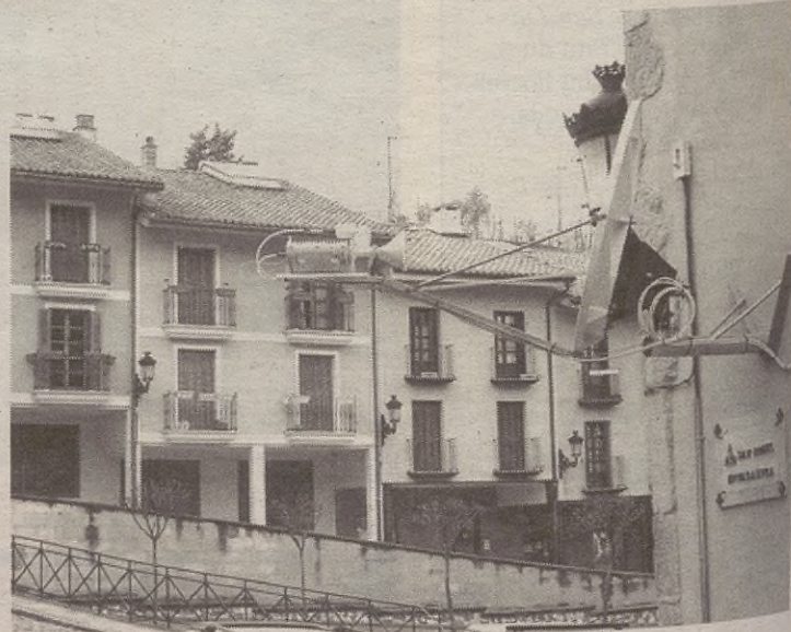
Kutzazaina erabili ahal izateko antena jarri dute.

Udaleko ordezkariak oraindik ez dakite noizko egongo den kutxazaina erabilgarri. Kutxara eta Telefonicara deituko dute, Gabonetan martxan egongo ote den jakiteko, baina euren esanetan, gaitza izango da hori lortzea. Badirudi herritarrek 2006ra arte itxaron beharko dutela.