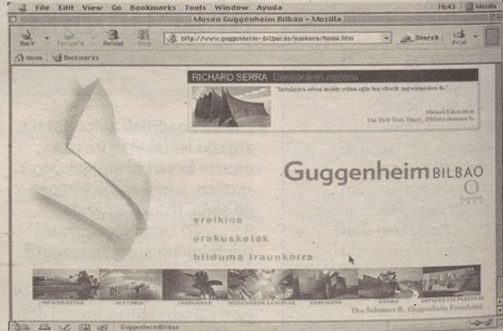
Bilboko Guggenheim museoko web orria.