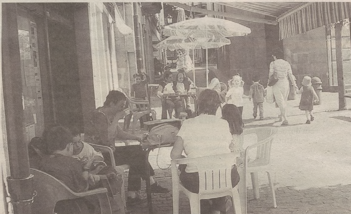
Merkatariek herrian giro apur bat jarri gura dute eta, bide batez, bezeroei eskerrak eman.

Eskoriatzako estankoko Balenen esanetan, "zerbait berezia egin gura genuen, eta oso argi