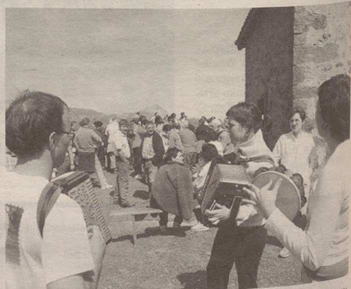
Hitzordua polita izaten da, eta gero eta lagun gehiago joaten dira.

Bitxikeri moduan, antolatzaileek esan digute gero eta gazte gehiagok egiten dutela bat hitzorduarekin. Eta Kurtzeberri bidean zihoazen lagunak, tartean aleman batzuk, ere egin zuten geladuna.