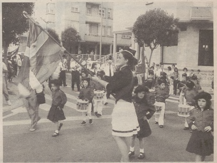
Saritutako esaldiekin pankartak eta pegatinak egingo dituzte jaietan.

Berak asmatutako ipuin sorta kontatuko die helduei, eta ordu eta erdiko emanaldia izango da.