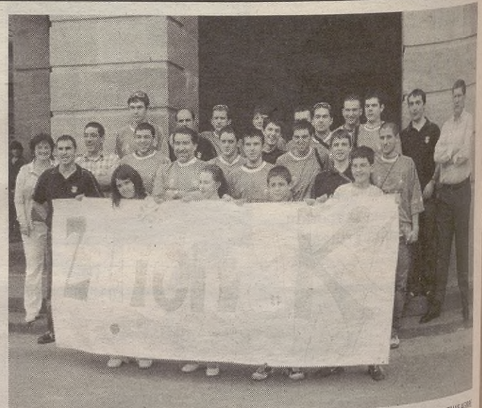
Joan den asteko ospakizunarekin ez dute denboraldia bukatu gura izan.

tzeko, txapelketa berezia antolatu dute. Bihar, zapatua, hiru talderen arteko areto futbol txapelketa egingo dute kiroldegian. 18:00etan izango da, eta honako taldeek jokatuko dute: Gasteizko Carniceria Sanz (lehen nazionalan jokatzen du), Gernika eta Eskoriatzak. Taldekoen esanetan, denboraldia bukatzeko modu polita da: "horrela denboraldia apur bat luzatuko dugu, zaleek partidua politikatu egingo dituzte, eta gonbidatuz gehiago ikasi ahal izango dugu".