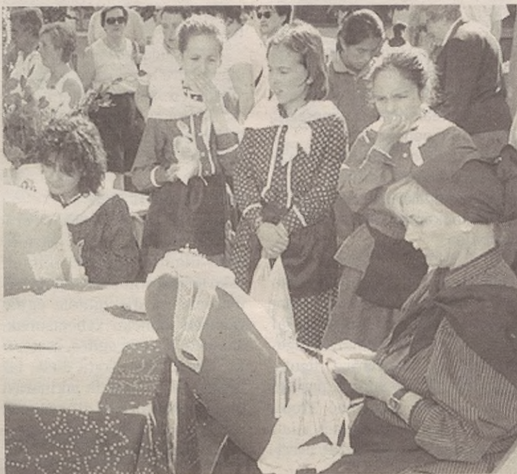
Antolatzaileak saiatzen dira adin talde guztiendako ekintzak eginen.

Antolatzaileek artisauari eskatzen diete aukera egonez gero saltokian bertan lan egiteko. Horre-