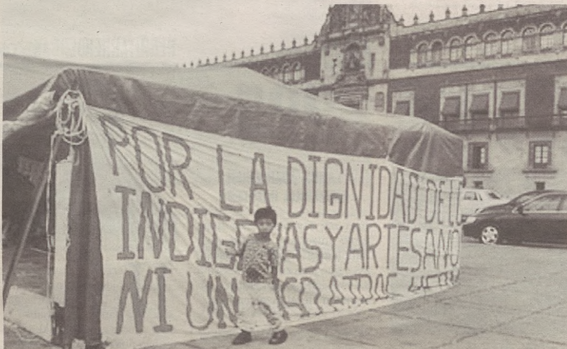
Txiapasen duten borroka ikusi eta gero erabaki zuten jai hori antolatzea, eta Txiapasen alde dirua batzea.

1994an Yurre Mexikora joan zen oporretan. "Turismoa egitera joan nintzen, baina oharkabean Txiapasen zelan bizi diren eta hango borroka ikusteko aukera izan nuen. Hark eragin egin zidan". Euskal Herrira bueltatu eta Txiapasera behatzaile joateko ikastaroa egin zuen. Orduetik hona hamar bider joan da. Urtero ibarrean batutako dirua hara eramaten du, eta ahal duen lanetan laguntzen du.