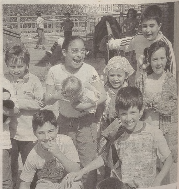
Luis Ezeizako ume eta gaztetxoak desentzen egoten dira urteroko jai heltzeko.

Bestalde, Gurasoen Elkarteak iragarri du hilaren 18an eta 19an Aitzorrotzen kanpaldia egingo dutela.