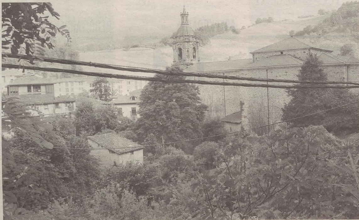
Santa Marinar, elizaren atzealdean, hainbat etxebizitza egingo dituzte.

Udalaren asmoa da promozio publiko horiek pribatuen aldi berean egitea, azken horien salneurria jaits dadin. Horrez gain, promozio bakoitzarekin eskuratzeko dirua lurzoru gehiago erosteko erabili gura dute. Hala, etxebizitza gehiago eraiki