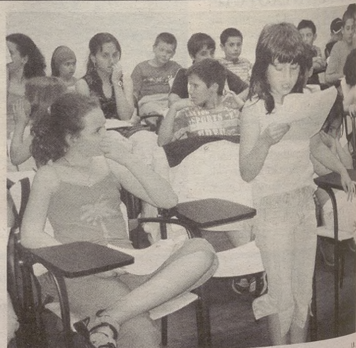
Udalerriko egoera aztertu ondoren, eskaerak egin zizkieten politikariei.

Ura aztertu dutenez, ibaiaren garbiketa gehiago egitea eskatu zuten. Udalak aditzera eman zuen aspaldian fabrikek gutxiago zikintzen dutela, eta Udalak gehiago garbituko duela.