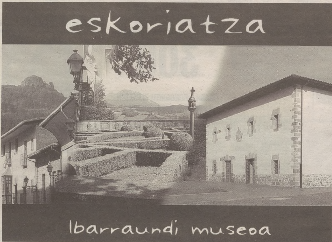
Udalerrira bisitariak erakarri eta bertan dauden altxorrek erakusteko ekimenak aurkeztuko dituzte.

Inaugurazio ofizialerako, Jaurlaritzako, Aldundiko eta Ibarreko udaletako hainbat ordezkari gonbidatu dituzte, baita ere museoarekin hartu-eman izan duten hainbat herritar. 17:00etan izango da ekitaldia,