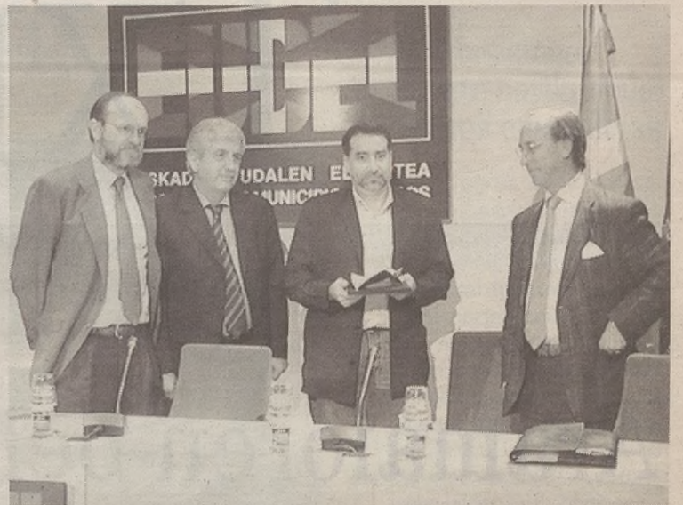
Argazkian, alkatea EVE eta Eudeleko ordezkariakin.

Alkateak azpimarratu zuen Udalak ahalegin horretan jarraituko duela, eta herriko eraikinetan eta argiztapen publikoan energia zelan aurreztu aztertuko dutela.