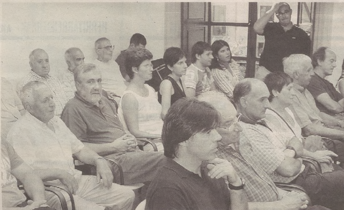
Osoko bilkuren aretoa leporaino bete zuten herritarrek. Autobidearen gaineko kezka zuten, eta horixe eztabaidatu zuten.

Udalbatzarrak Dorleta auzoa berriro urbanizatzeko proiektuaren hasierako onarpena egin zuen. Uztailean lanean hasi gura dute. Horren harira, alkateak azpimarratu zuen ailegaeraztasun plana dela eta, etxabeak dituzten auzotar batzuk haserre daudela, ezinago dituztelako garaje moduan erabili. Bestalde, udalbatzarrak onartu zuen lokalak etxebizitza bihurtzeko ordenantza aldatzea. Espekulazioari aurre egiteko, eros-