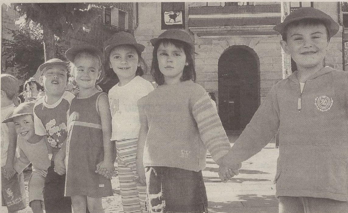
Umeak udalekuak hasteko deseatzten zeuden. Poz-pozik elkartu ziren herriko plazan, astelehenean.

Udalak antolatzen ditu, eta aurten gutxienez 15 urte beteko dituzte. Izan ere, oso harrera ona dute udalekuek. Aurten, adibidez, 175 umek eman dute izena. "Umek asko eskertzen dute halako aukerak izatea, bestela aspertu egiten direlako. Eta gurasoek ere ondo hartzen dute, sasoi horretan lanean ibiltzen direnez umekin egoteko denbora nahikorik ez dute lako izaten", azaldu ziguten.