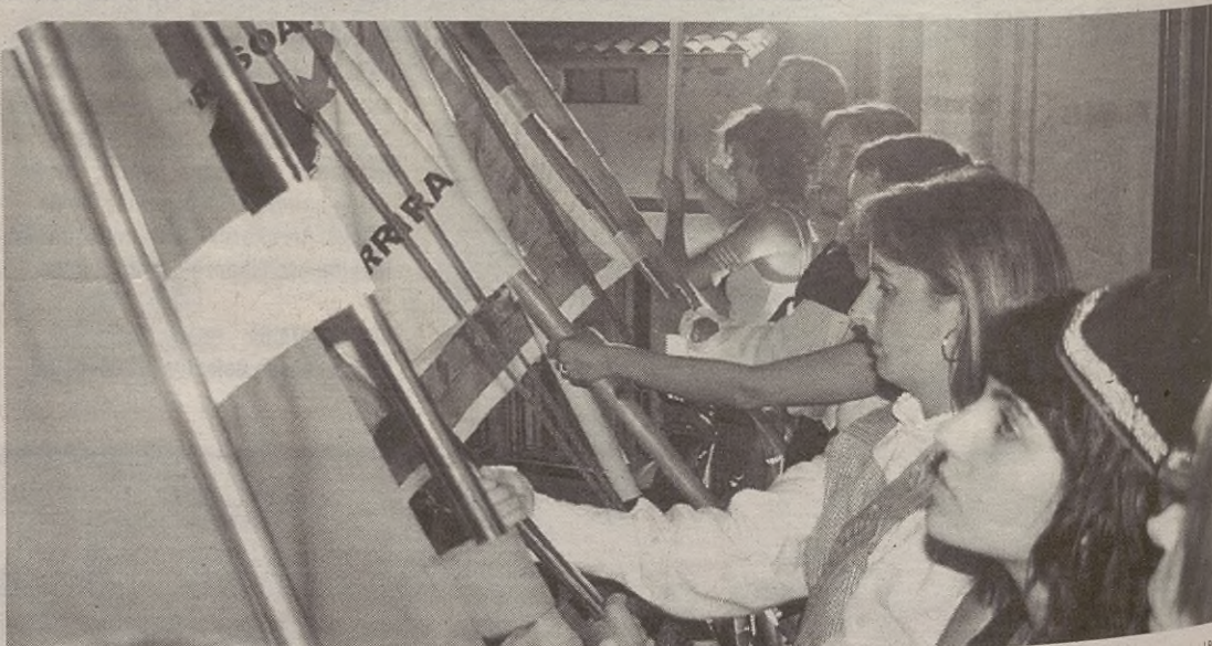
Euskal Jaiaz gain, danborradak —nagusiena eta umeena— ere galdu ezinezko hitzorduak dira eskoriatzarrendako.

Udal ordezkariak eta gazteek eurek diote Euskal Jai egun politenetakoa dela. Horrez gain, gazte batzarrekoak oso pozik daude San Pedroak zapatara arte luzatu dituztelako. Koadrilen eguna egin zuten, eta arratsalde eta ilunkaran oso harrera ona izan zuten kalejirak, jokoak eta kontzertuak.