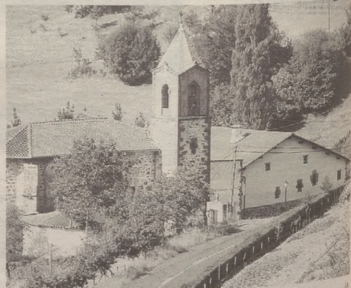
Gellao auzoan dago eztabaida sortu duen bideetako bat.

Bitartean, esandako moduan, lekukoekin elkarrizketak izan dituzte eta alegazioak jaso dira. Eguenean bertan bildu zen batzar informatiboa interesatuekin, eta gaurko osoko bilkuran jorratuko dute gaia erabakia hartzeko.