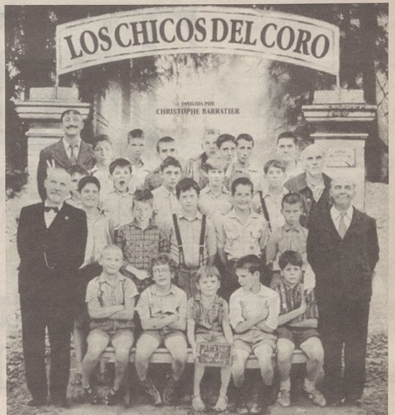
Astelehenean eskainiko dute Los chicos del coro film frantziarra.