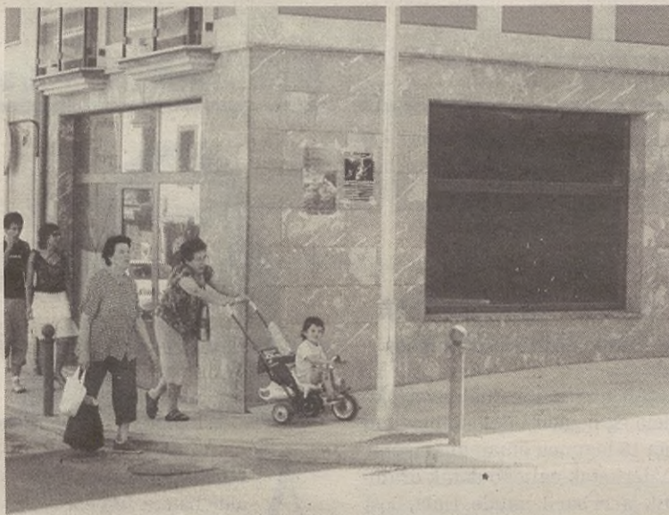
Azkenaldian espekulazio handia egon da bizitzeko egokitutako etxabeetan.

Herriko etxebizitza aukera urritasunari konponbideak topatu guran dabil Eskoriatzako Udala. Ohiko etxebizitzaren prezioaren garestitzearekin bat, gero eta urriagoak dira eraikitze egoiak diren lursailak. Leku egokian ez egoteagatik erabiltzeke edota hutsik daudelako, askok etxabeetan etxebizitzak egiteko aukera ikusi dute orain. Alternatiba horrekin etxebizitza kopurua hazteko aukera legoke, eraikitze orubeak agortzen jarraitu barik. Udalez gain herritar askok ere etxabeak modu horretan erabiltzea pentsatu dute eta baimen eskaera ugari iritsi dira Udalera azkenaldian. Gainera, jakin duteenez, espekulazioa ere egon da etxabeetan egokitutako etxebizitza horien salmentan, eta horregatik