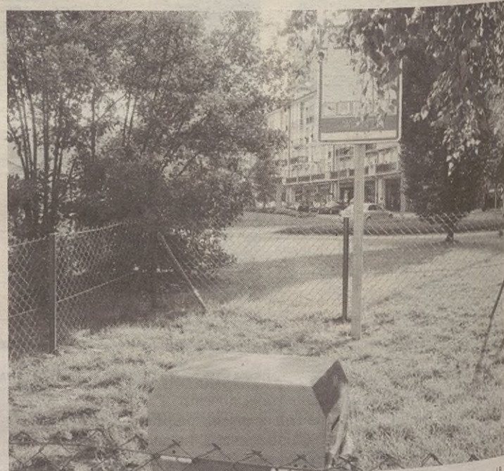
Arrasaten ipini zituztenen moduko pipi-can -ak ipiniko ditu Udalak.

bestez, lursailetan, txaletetan, terrazetan edo antzekoetan dauden txakurrek beti lotuta egon beharko dute, bestelako eremu hesiturik ez badaukate. Gai horren inguruan ere, datozen asteetan pipi-can eremuak ipiniko ditu Udalak herriko sei edo zazpi kaletan. Izan ere, debekatuta dago animalien gorotzak kalean uztea, eta animaliak ezinbestean libratuz gero jabearen arduraz litzateke eginkariak jasotzea. Hori egin ezean eta araudi berriaren arabera, isunak ipintzeko eskubidea izango du Udalak.