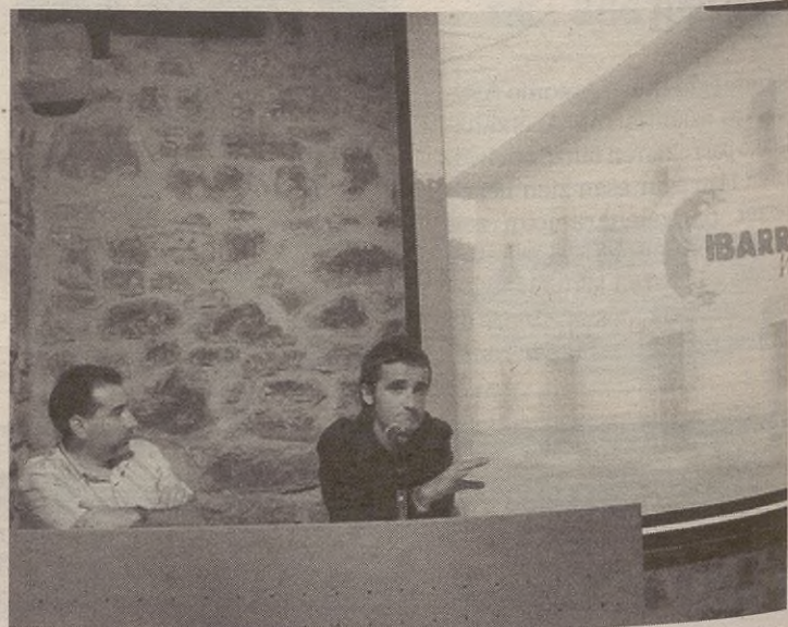
Argazkian, DVDaren aurkezpena, Ibarraundi museoaren inaugurazioan.

Aipatutako DVDaz gain, Ibarraundiko logoa daukaten elastikoak, bitxiak eta bestelakoak daude salgai museoan. Are gehiago, ibarreko eta Euskal Herriaren gaineko turismo informazioa ematen dute.