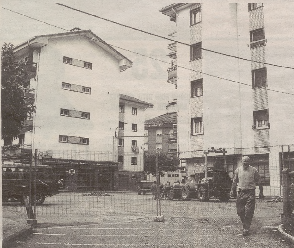
Etxebizitza jabetzan hartzea da gehien nahia, baina 156.300 euroko prezioa gainditu barik

Izan ere, etxea eskatzeko arrazoiak beste ildo batetik doaz txostenak argitu duenez, hau da, gurasoen etxea utzi edo familia berria osatzeko utzi gura dute etxea. Izan ere, inkestatuen %68 hiru edo