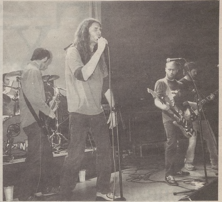
Oñatiko Amonal taldea izango da jaialdiko taldeetako bat.