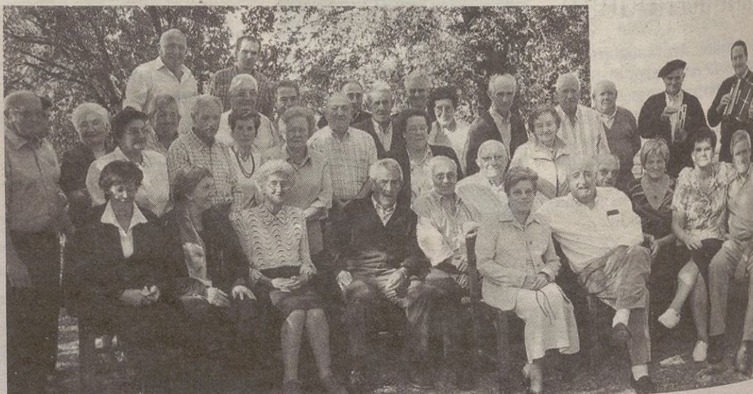
Argazkian atsedean hartzen harrapatu genituen, baina ia ez ziren egun osoan geldirik egon.

Eguna ondo bukatzeko, Laja eta Landakanda trikitilariak erretiratuak dantzan jarri zituzten iluntzera arte.