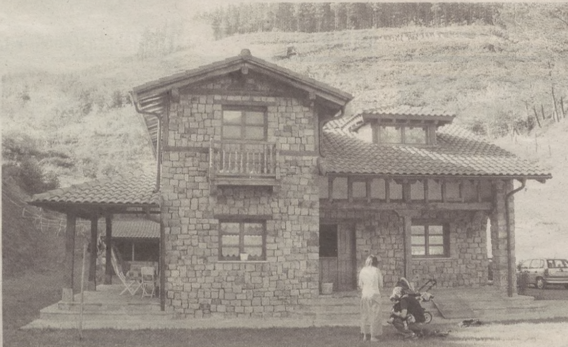
Irudian Antontxu baserria, eta gainaldean kamioi bat autobideko lanetan.

Horrez gain, autobideak kaltetutako taldeak aditzera eman du Aranburuzabala kalearen gainaldean dagoen Antontxu baserriko hormetan pitzadurak sortu direla. Etxe hori autobideko lanetatik 150 bat metrora dago. Han bizi direnek esan digute lehenengo leherketa entzun zutenean izugarritzko sustoa hartu zutela,