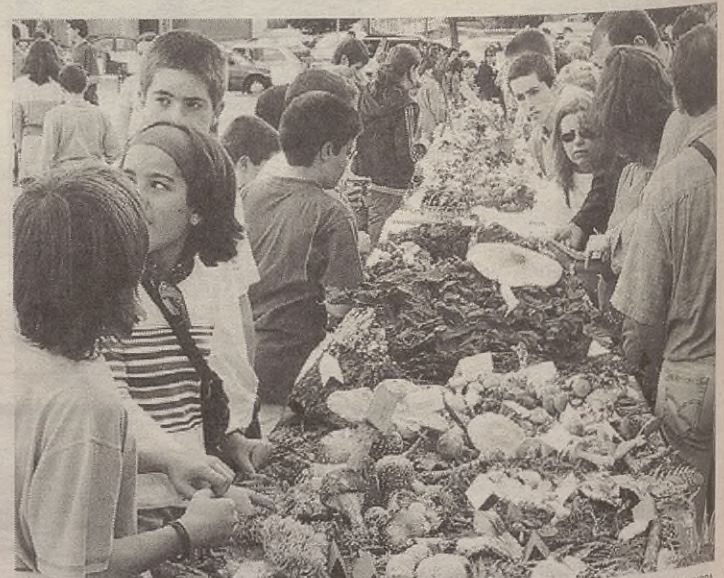
Ibarreko herri gehienetan egingo dituzte perretxikoen gaineko ekintzak.

Domeka goizean, hilaren 16an, perretxiko erakusketa egingo dute plazan. Horrez gain, perretxikoen eta bestelakoek dastatzea egingo da.