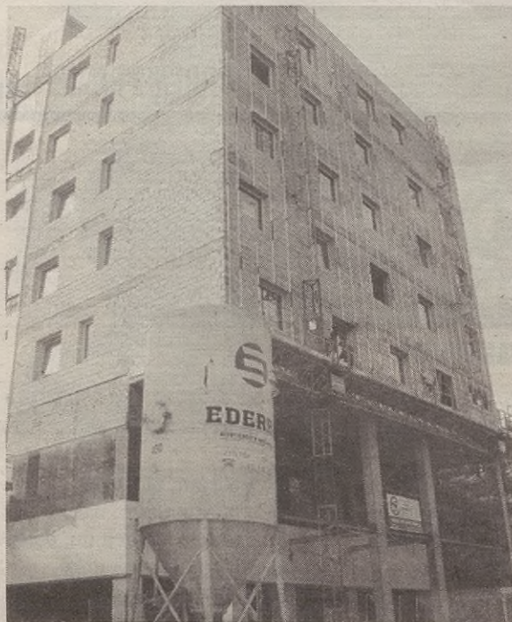
Torrebason, laster, Mendigoia hotela inauguratuko dute; eta Azkoaga etxean, hotel txiki bat egiteko proiektua dute.

Hotelak 300 lagunendako jan-gela-aretoa izango du, enpresek erabil dezaten edo ospakizun bereziak egin ahal izateko. Eguneko