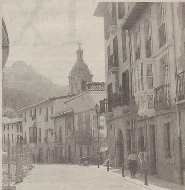
Udalak egindako ikerketaren arabera, herrian 50 bat etxebizitza daude hutsik.

ERRENTA DUINA ORDAINTEKO AUKERA Horrez gain, etxebizitza errentan hartu gura dutenek duten diru sarreraren arabera errenta ordaindu beharko dute, eta Etxe-