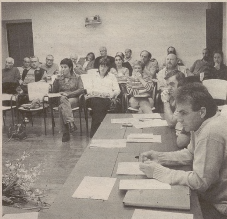
Hainbatek desadostasuna erakutsi zuten autobidearen gainean erabakitakoarekin. I.B.

Areka BTT elkarteak eta Udalak XVI. Mendi Bizikleta Ibilaldia egingo dute domekan. 09:30ean irtengo dira herriko plazaatik Aretxabaletarantz, baina interesatuek ordu erdi lehenago eman beharko dute izena. 38 kilometroko ibilaldia egingo dute. Baldintza bakarrak izango dira 14 urte baino gehiago izatea eta kaskoa erabiltzea. /I.B.