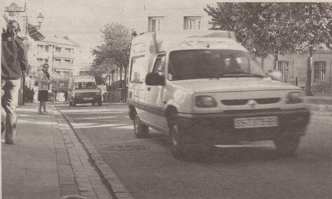
Santa Ana eta Olazar kaleen arteko bidegurutzetik San Juan kale hasierara arteko zatian ezingo dira autoak ibili.

Aretxabetatik datorren bidean, Eskoriatzako sarbidea eraldatu egingo dute eta han biribilgunea jarriko dute. Aretxabetatik Eskoriatzara noranzkoan eskuinaldean joango da tranbia eta bi errei izango ditu. Industrialdeari dagokionez, Ederlan ondoko biribilgunea kendu egingo dute eta bes-