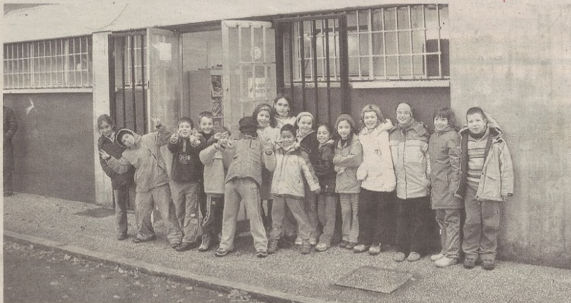
Luis'Ezeiza eskolaren parean jarriko dute, eta 12 eta 16 urte bitartekoendako da. Argazkian, etorkizuneko erabiltzaileak.

Udaleko Gazteria Sailak erabaki du zerbitzua egubakoitzetik domekara bitartean ematea. "Premia handiagoa dagoela ikusten badugu, zerbitzua egun gehiagora luzatuko dugu, baina jakin badakigu aste barruan adin horretako gaz-