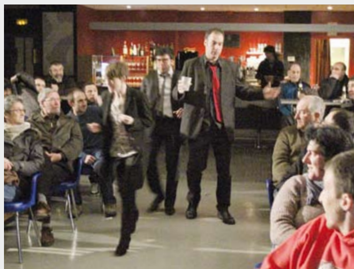
Bodologuak lana egin zuten Espaloian 2012ko otsailean.

Elgetan ere izan ziren, eta etxean moduan daudela diote Espaloian. Gustura daude, monologista on asko izan diren taula gainean izango direlako berriz. Deseatzen daude egindako lana erakusteko.