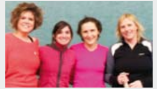
Txapelketako bikote bi.

Emakumeen frontenis txapelketa azken txanpan sartu da. Final-laurdenak jokatuko dituzte bihar; norgehiagoka biziak, seguru. Zortzi bikoteetatik bost aretxabaletarrak izango dira.