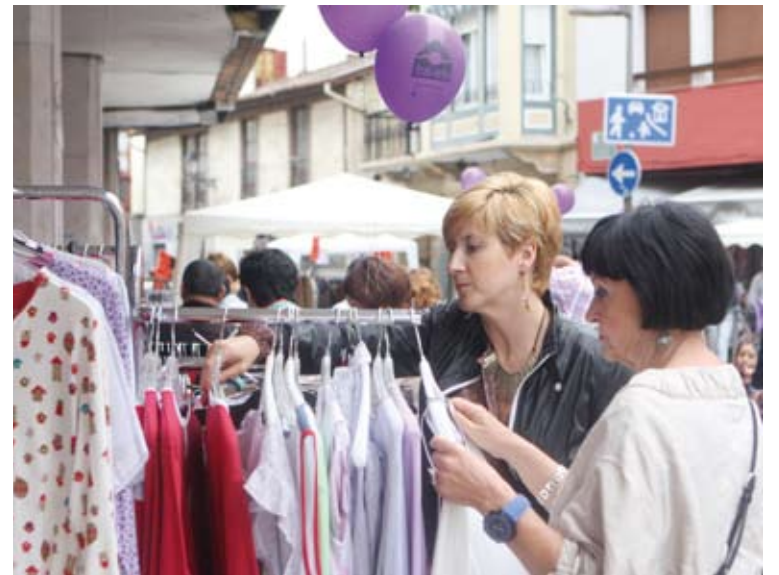
Bi herritar eskaintzei begira, azken Merkemerkauan. | IMANOL SORIANO