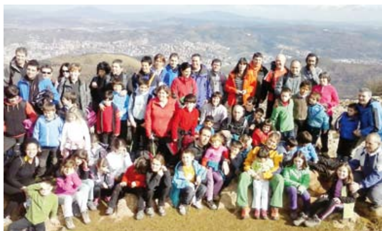
ARRASATE HERRI ESKOLA

Ikasketak aukeratzeko. Gerora nire gus-tuko gaietan sakontzen nuen, erraza izan da ikasketak aurrera eramatea. Orain ikasten nabilen bigarren ziklo honetan hainbat materia baliozkotuta ditut aurreko ikasketak direla-eta. Beraz, ez zait gogorra egiten ikasten aritzea.