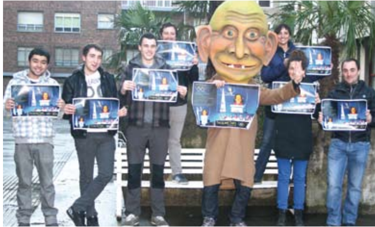
Txapel Txin, Karnabalen Lagunak taldeko hainbat kide lagun dituela. | M.A.

Goiz partea trikiti doinuek girotuko dute, eta kuadrillak izango dira kaleetako protagonista. Jaia, ostera, ilunkaran hasiko da. Teatrak Lakalle antzerki taldeak suarekin egindako espektakulua eskainiko du, kalean gora eta behera (18:30) –Herriko plaza, Durana eta Mitarte kaleak–. Eta batzuk suari begira dauden bitartean, beste batzuk lanean jardungo dute. Torrada lehiaketako epaimahaia elkartuko da orduantxe eta behin dastatuta txapeldunak izendatu. Torrada horiek norberak etxean eginda eroan behar ditu (8 torrada) eta 18:00ak eta 18:30ak bitartean aurkeztu plazan, izen-abizenak kartazal itxi batean zehaztuta.