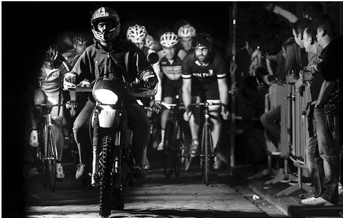
Surfixed lasterketaren hasiera, San Anton kalean, joan den urtean. | ANTON MIETTINEN