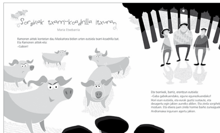
Liburuxkako pasarteetako bat.