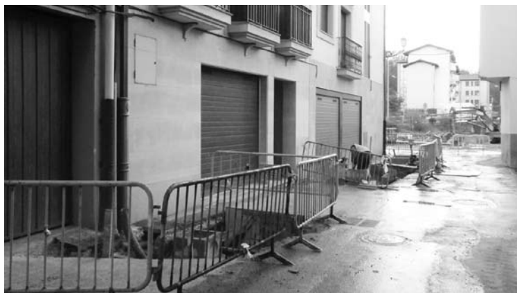
Aozaratza kalea, obretan.

Friendship programarekin herriko ikasleak lege soziologiaren askotan entzun badute ere, askotan galdetzen ei dute zer den, zehazki, eta horregatik antolatu dute hitzaldia.