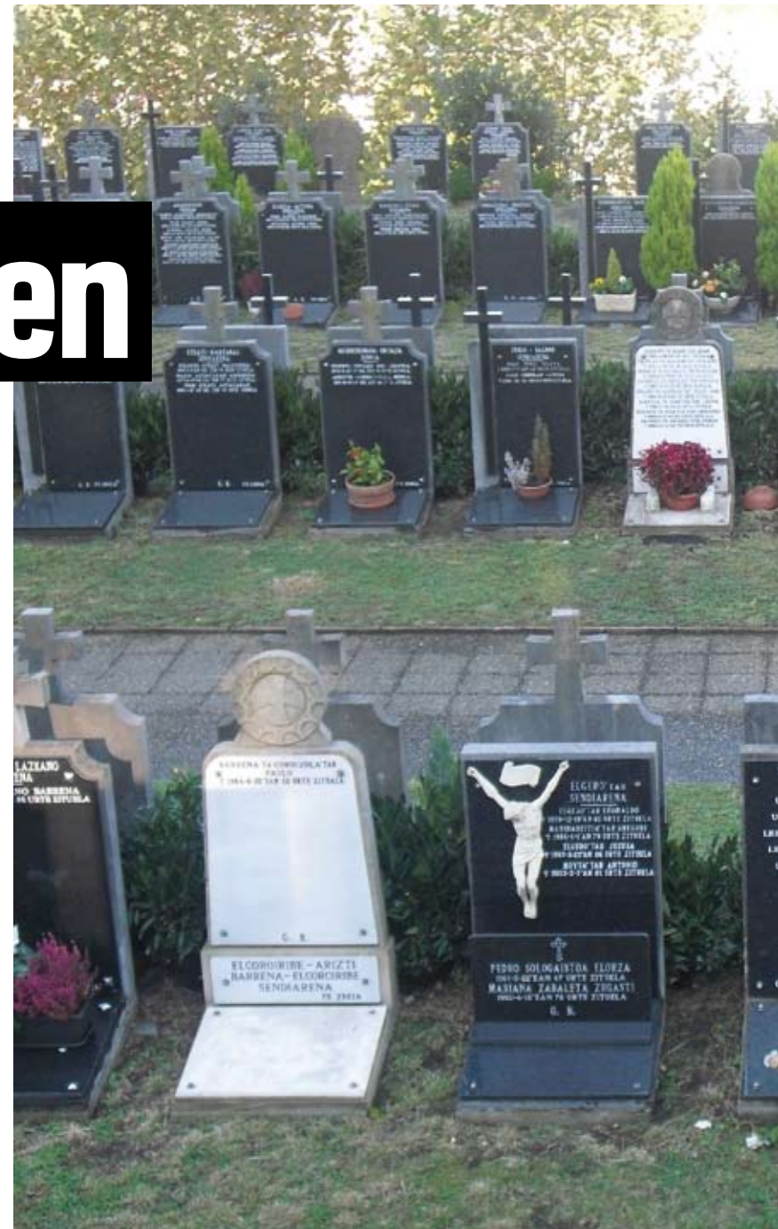
Oñatiko hilerriko irudia.