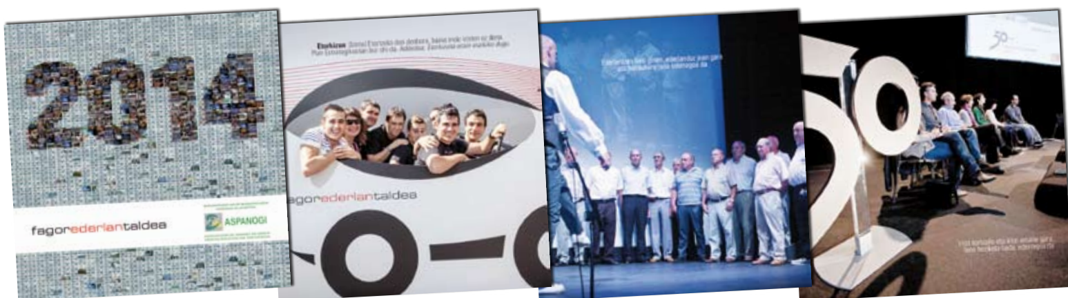
Egutegian azaltzen diren argazkietako batzuk. | FAGOR EDERLAN