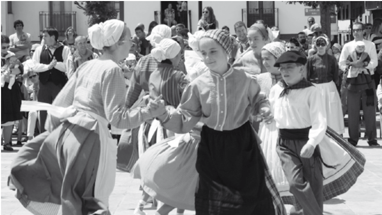
Euskal dantzak, iaz, Ferixa Nagusiko jaietan. | IMANOL SORIANO