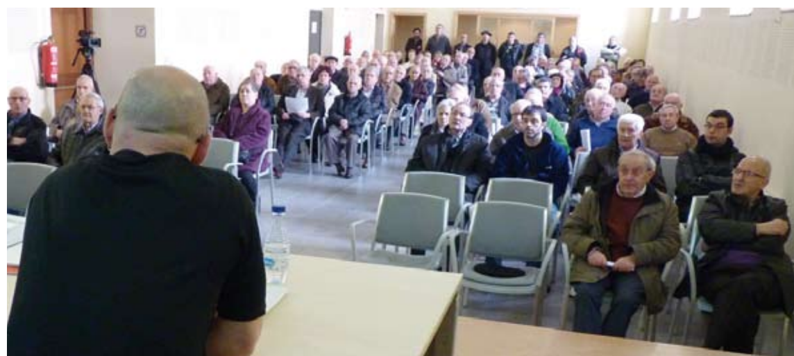
San Felipe Apostol Elkarlaguntza Elkartearen aurtengo batzarra. | J.I.

Aretxabaletako kofradia bezala, Arrasateko San Felipe Apos-