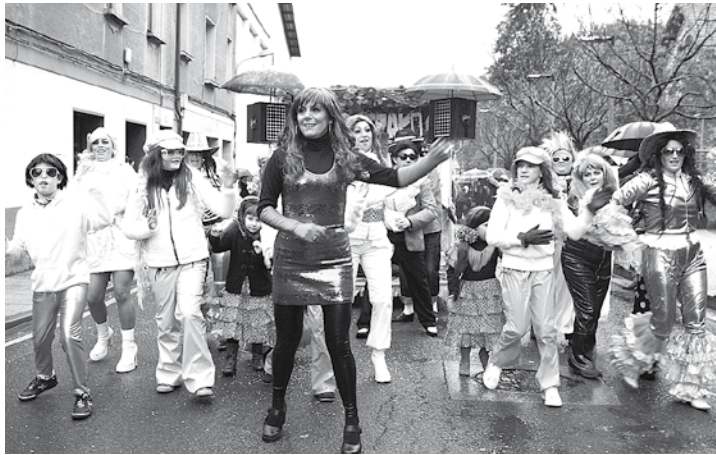
Joan den urtean kalera ateratako mozorroak. | IMANOL SORIANO