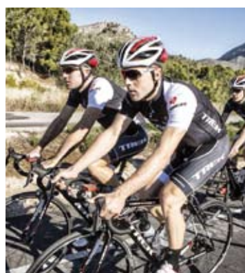
Irizar, talde berriaz.

Oñatikoak, baina, ez zuen zorte ona izan distantzia motzeko erlojupekoan, zulatua izan zuen eta aukera guztiak galdu.