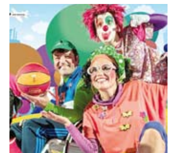
Bizipoza saiokoa. | KATXIPORRETA.COM

Modu tradizionallean eskuratu gura izanez gero, berriz, kultura etxean izango dira salgai. Eguaztena ezkerro daude salgai; beraz, guztiak saltzen ez badira, behintzat, emanaldiaren egunean bertan ere leihatilari erosi ahal izango direla azpimarratu dute Bergarako Udaletik.