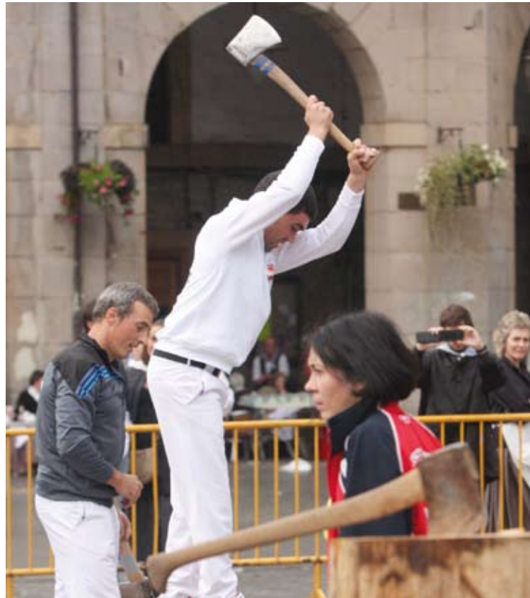
Herri Egunean, plazan, egindako herri kirol erakustaldia.