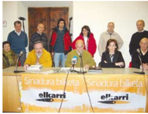
Elkarriko kideen agerraldia. | AMAGOIA LASAGABASTER

Jendaurrean egindako agerraldi batean, Elkarriko kide eta boluntarioek Debagoiengan 1.500 sinadura batzeko helburua agertu zuten Bake Konferentziaren aldeko kanpainaren barruan. Anekdotan moduan, esan behar da elurra zela-eta astebete atzeratu behar izan zutela ekimena. Azkenean, martxoaren 6an egin zuten sinadura bilketa, eta, aurreikuspenak gaindituz, 3.245 sinadura batu zituzten gure bailaran.