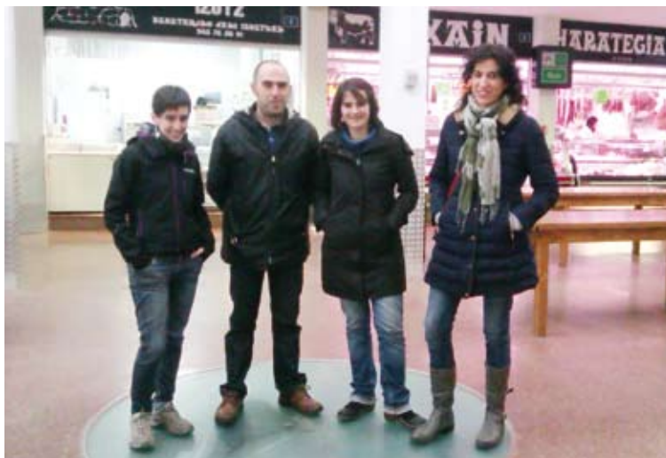
Azoka biziberritzeko Udalaren eta Bagararen prozesu parte hartzailea.

Batetik, eraikineren erabile-raren azterketa egingo da. Bes-