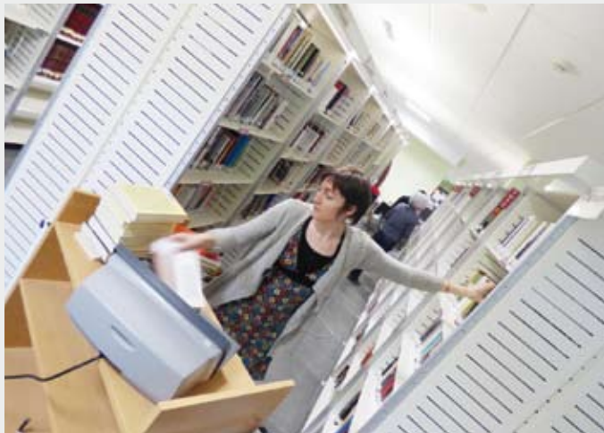
Langile bat sistema zaharra desaktibatzen, martitzenean. | J.B.

Arrasateko Askapenak hitzaldia antolatu du biharko, Europa Astinduz ekimenaren barruan. Izquierda Castellana elkarteak bi kide gonbidatu dituzte antolatzaileek Irati tabernan; 10:30ean elkartuko dira gosaltzeko eta 11:00 aldera hasiko da saioa. Herri boterearen inguruan dauden esperientziez jardungo dute eta, besteak beste, Madrilgo auzoetako dinamikak eta Burgosko Gamonal auzoan gertatutakoa izango dira adibideetako batzuk.