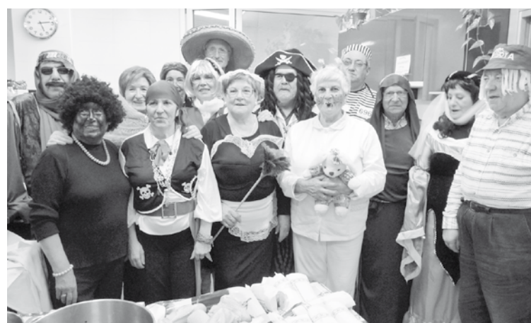
lazgo afari festan erretiratuak moztortuta. | GOIENA

Inauterietako martitzenean, hau da, martxoaren 4an, afaria egingo dute erretiratuek. Bada, afaltzera joan nahi dutenek izena eman beharko dute datorren astean, hilaren 25ean edo 26an, erretiratuen bulegoan, 16:00etatik 18:00etara. 4 euro ordaindu behar da. Aurten, baina, afariaren ondoren kinan jokatu beharrean dantzaldia egongo dela jakinarazi dute erretiratuen elkartetik. Eta, iaz bezala, afarira moztortuta joateko dei egin dute.