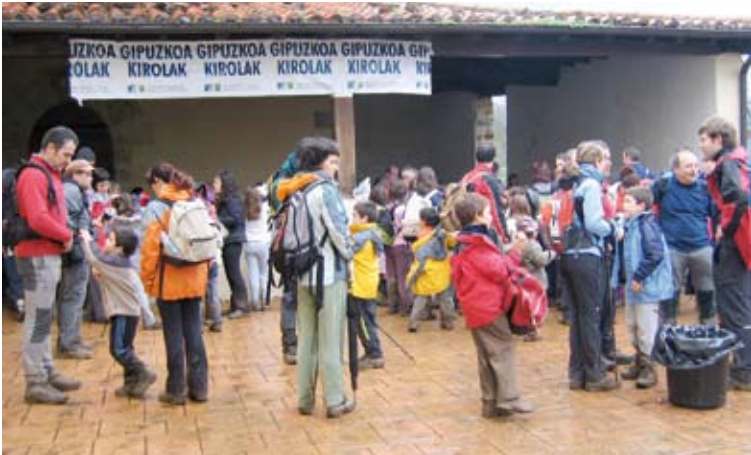
Mendizaleak Areantza auzora iristen orain dela bost urte. | M.A.