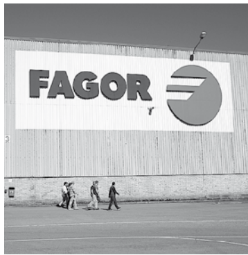
Garagartzako planta. | J.D.

Izan ere, operazio enpresarial horren gaineko azkeneko erabakia Mondragon Taldetik eta Debagoienerako kanpo dago. "Frantzia-