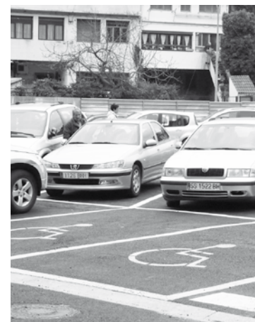
Aparkaleku berria. | M.B.

Horren bueltan, Udalak sentsibilizazio kanpaina jarriko du