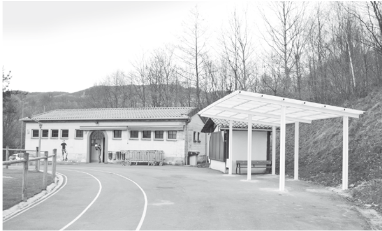
Aterpe berria prest dago futbol zelaian. | ANE ETXEBERRIA

Orain arte, tabernak duen aterpe txikian batzen ziren zaleak, baina orain, banderen eta tabernaren artean beste leku bat dago, beste espazio bat. Atletismo pistarainoko zabalera du, baita teilatu bat ere. Oraingoan, hori da dagoena, baina asmoa da aldamenak ere egitea; hau da, alboak itxi haizetik eta euritik hobeto babesteko. Kirol zinegotzi Aritz Saidiren esanetan, "aurreikusitako aterpearen tamaina baino handiagoa egin da", herritar asko joaten baita zelaira.