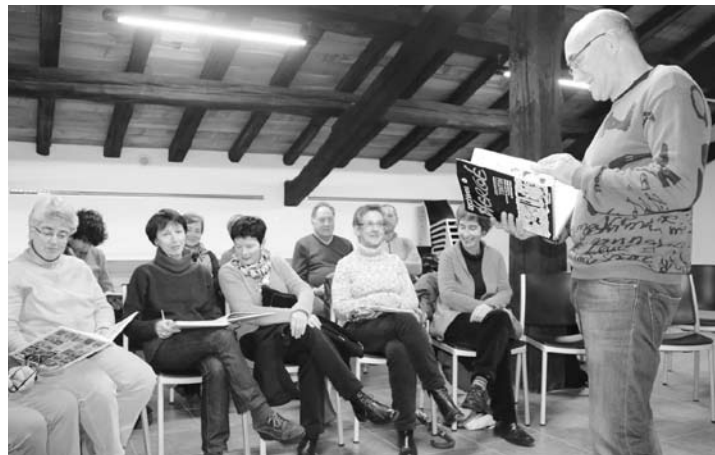
Eguaztenean gaztelarako taldeak egindako solasaldia. | IMANOL GALLEGU

Bai, baina adiskidetasun hori gatazkaren erdian gertatzen da eta gertakariak kolokan jarriko dute Aitorren eta Asierren arteko erlazioa.