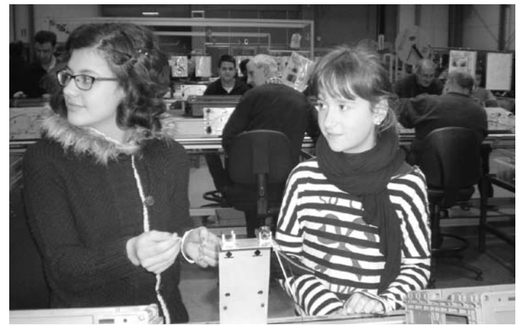
Ikasleak, Gureak-en tailerrean.

Honez gain, tailerreko bisitok in ikustarazi nahi dute "taldeko lanaren bidez gauza handiak lor daitezkeela" eta "persona guztiek funtzio bat dutela", ardura gehiago edo gutxiago izan.