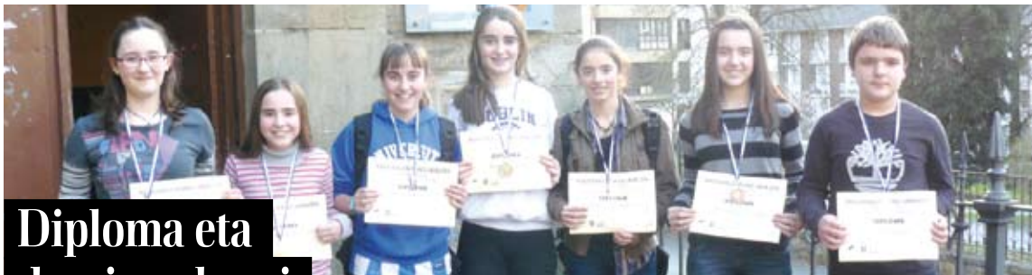
BERGARAKO MUSIKA ESKOLA

Aurkeztu beharrekoak dira: Ogasun eta Gizarte Segurantzako agiriak, denboraldirako egitasmoa, aurrekontua, taldearen ezagueriak, zein den entrenatzailea, ze lehiaketatan parte hartuko den, ze torneo edo ekintza antolatuko diren eta Udalarekin batera ze ekintza antolatuko den edo Udalak antolatutako ze ekintzatan parte hartuko den. Bestalde, 2013. urtean Udaletik jasotako diru kopurua justifikatzen duten fakturak eramatea ere eskatu dute. Hori ere martxoaren 7a baino lehen, udaletxera.