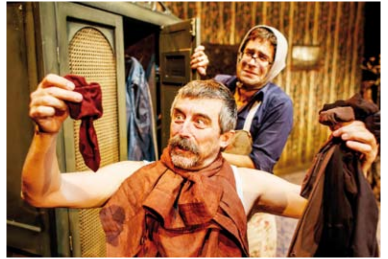
Erpurutxo antzezlanean protagonista.

Lopezek aditzera eman duenez, nahiz eta haurrentzako ikuskizuna izan, helduek ere gozatuko