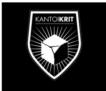
Logoa eta irudia. | KANTOIKRIT

da Kantoikrit. "Oso pozik antolatu dugu proba hori surf festaren barruan, baina zein harrera ona izan duen ikusita eta bizikletaren inguruan zerbait gehiago egiteko asmoarekin, atera egin dugu lasterketa hori surf festatik. Bizikletaren inguruko hainbat ekitaldi izango dituen asteburu oso bat antolatzea da gure asmoa, eta horren barruan sartuko da