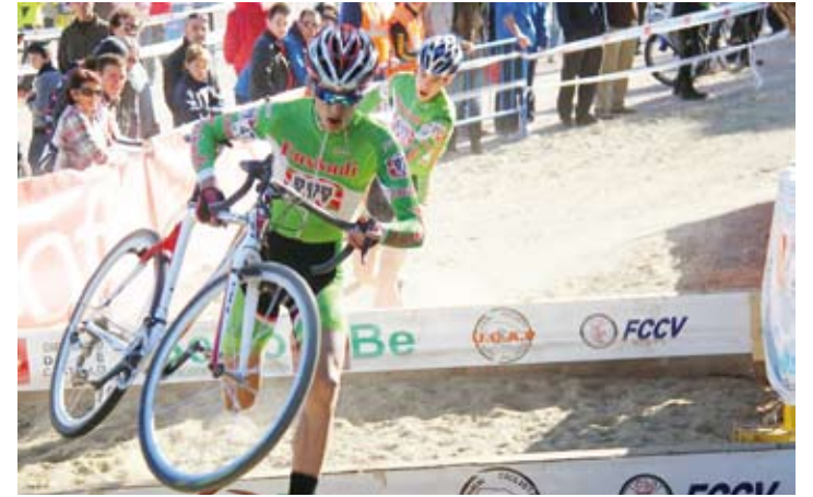
Umerez, Espainiako txapelketan, Segorben (Castello). | ARRIKRUTZ-ALOÑA MENDI

Bi urte barru, 2016an, jokatu du Paralinpiar Jokoak Brasilen, eta hara joatea gustatuko litzaioke. "Ederra izango litzateke, bai. Oraindik, baina, urruti ikusten dut hori. Auskalo".