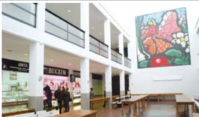
Azokako goiko solairuan egongo da ludoteka.