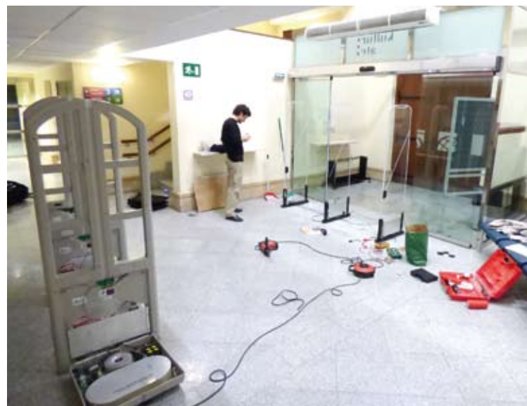
Irteerako detektagailu zaharrak kendu -ezkerrean- eta berriak jarri dituzte.

Bibliotekako arduradunak ere honela dio: "Egin beharreko lanak ikusita, guztiz ezinezkoa da halako egun baten biblioteka zabalik mantentzea".