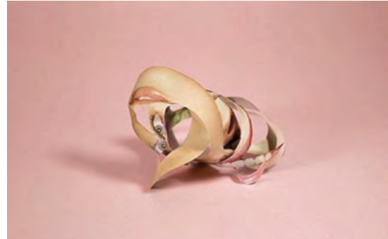
Caro Mantke bodybuildings