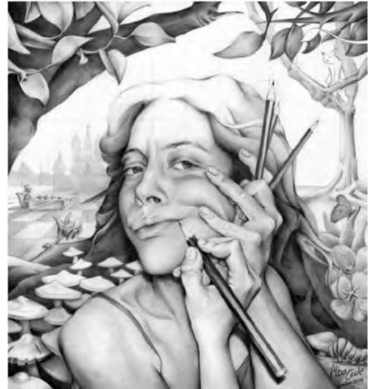
"REVERSE PORTRAIT" , 2024

El proceso es tan importante como el resultado.