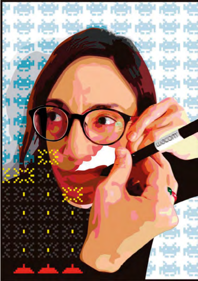
"AMAITU GABEA" (Inacabado), 2023