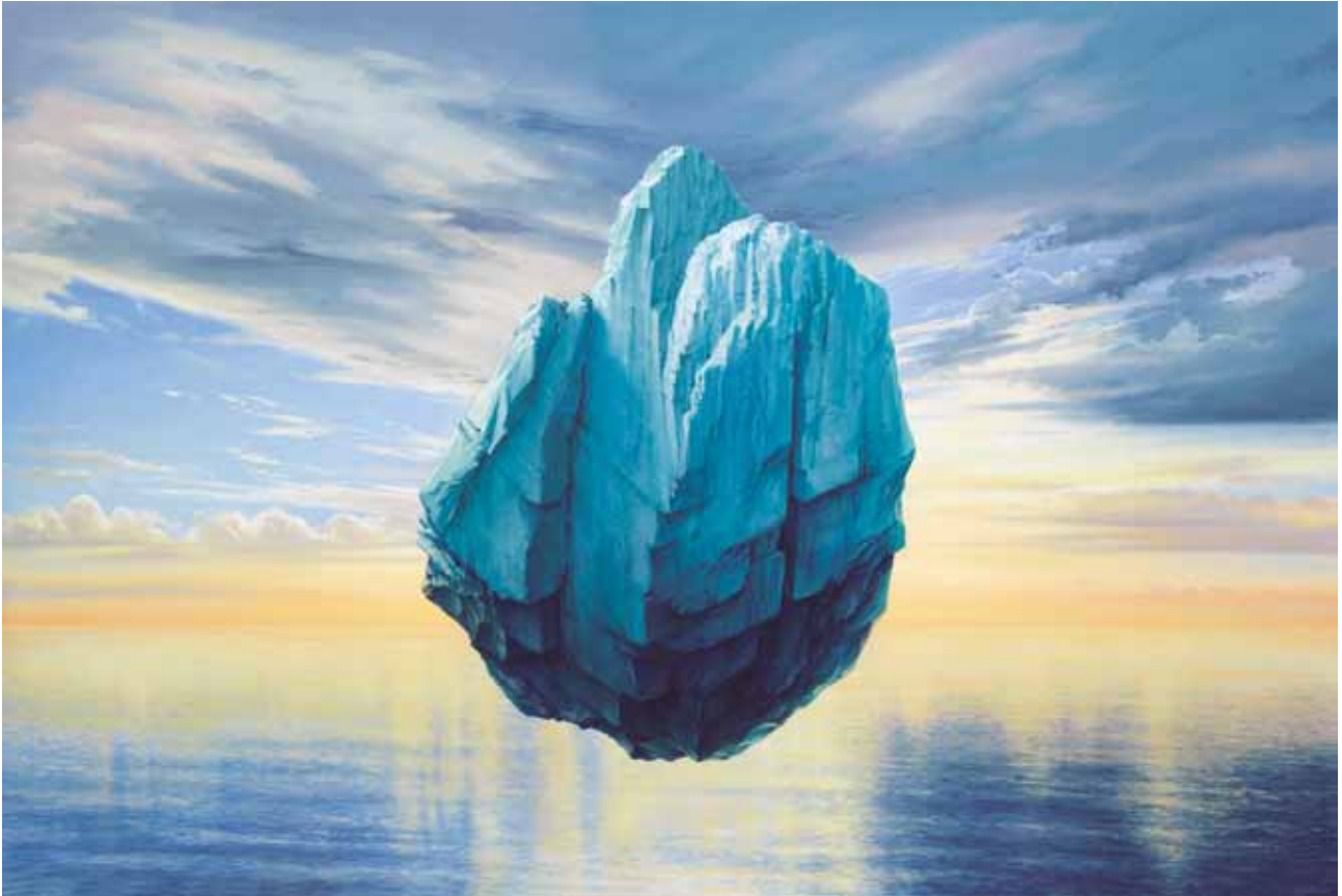
Gravitation II Akriliko mihise gainean • Acrílico sobre lienzo 155 x 225 cm 2013