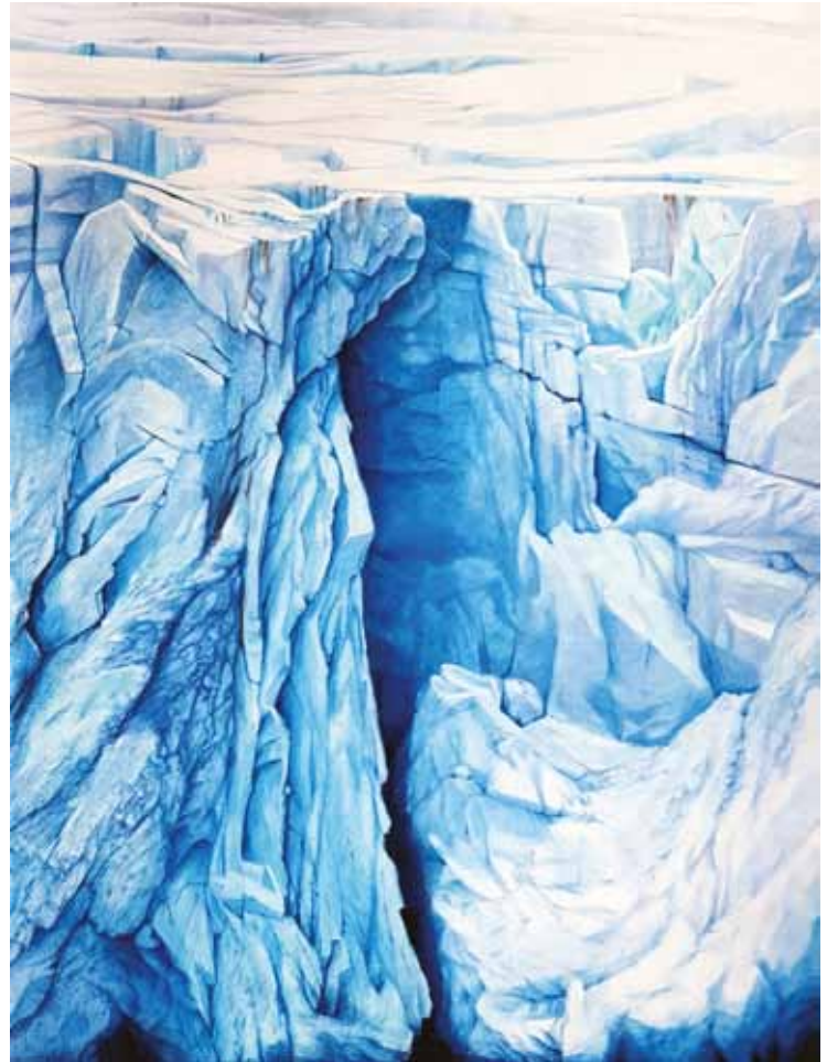
Raudfjorden I, II, III Koloretako pastela eta arkatzak paper gainean Pastel y lápices de colores sobre papel 146 x 110 cm bakoitzak / cada uno 2017