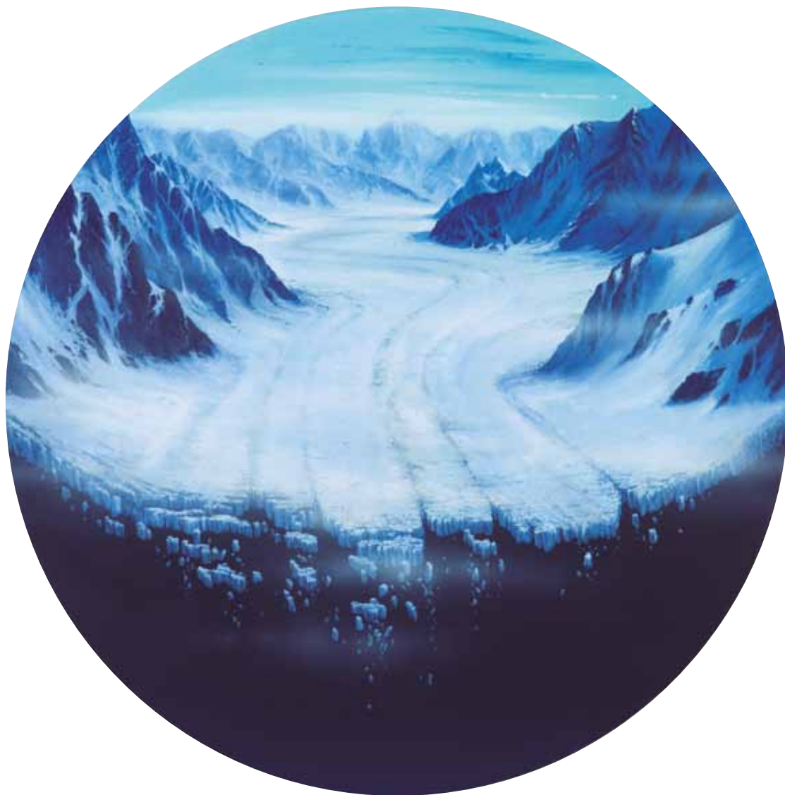
Todo lo sólido se desvanece en el aire Akrilikoa oihal gainean • Acrílico sobre tela 80 cm-ko diametroa • 80 cm de diámetro 2014