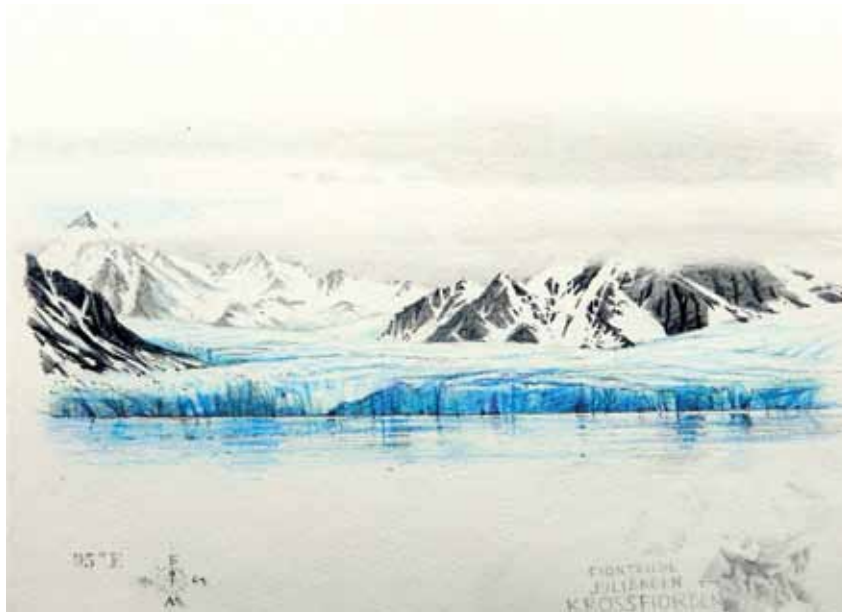
Cuaderno del Ártico II Grafitoa eta koloretako arkatzak paper gainean Grafito y lápices de colores sobre papel 19,5 x 25 cm 2017

Aurreko orrialdean / Página anterior: Todo lo sólido se desvanece en el aire II Akriliko oihal gainean Acrílico sobre tela 210 x 411 cm 2014