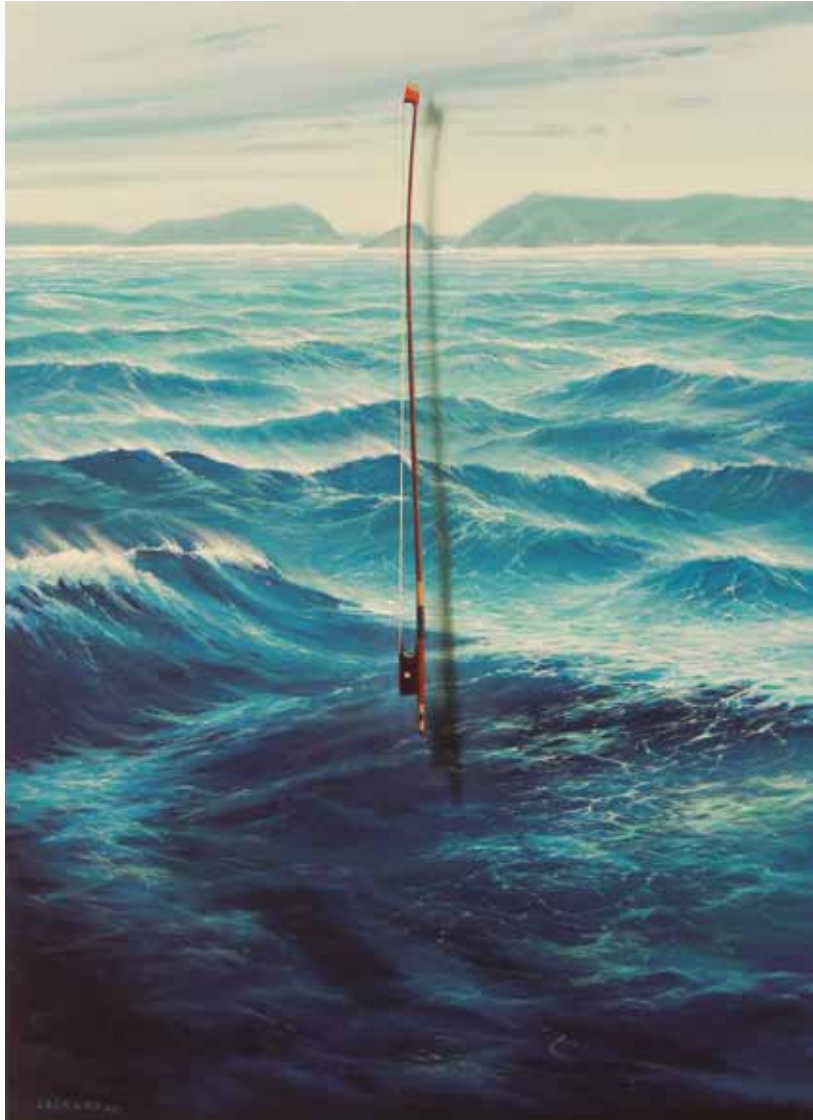
Donostia Akriliko mihise gainean • Acrílico sobre lienzo 100 x 73 cm 2015