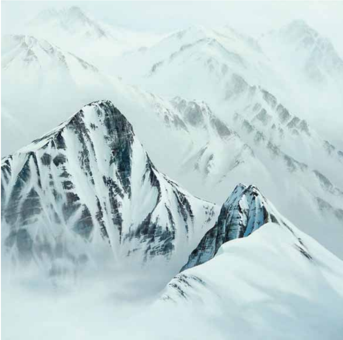
Bradford now Akriliko mihise gainean • Acrílico sobre lienzo 150 x 150 cm 2020