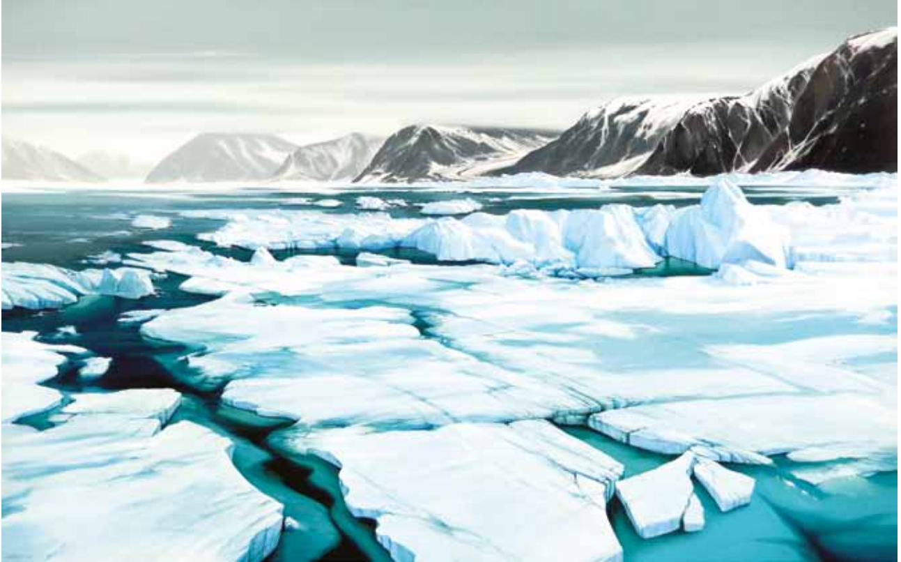
Svalbard Akriliko mihise gainean • Acrílico sobre lienzo 125 x 200 cm 2019