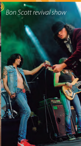
Bon Scott revival show